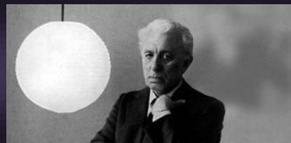
Franco Fortini, pseudonimo di Franco Lattes (Firenze, 10 settembre 1917 – Milano, 28 novembre 1994),